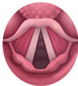
cordes vocales lors de la respiration

Lorsque le chanteur prend sa respiration, les deux cordes vocales s'éloignent l'une de l'autre – on a alors l'impression qu'elles forment les deux côtés égaux d'un triangle isocèle. Lorsque le chanteur chante, elles se rapprochent et semblent se joindre. À partir d'une certaine vitesse, l'air qui passe dans l'interstice fait vibrer les cordes, ce qui produit ce que l'on nomme un son voisé. Notons que la voix parlée possède elle aussi des sons voisés (toutes les voyelles et certaines consonnes comme /k/t/p/).