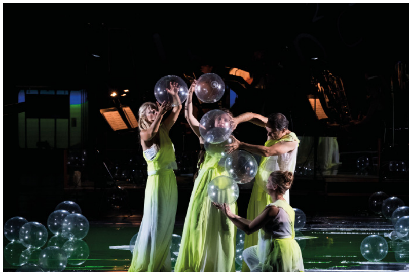
Kein Licht 2017-2018 Opéra national du Rhin

L'opéra ne reste pas en marge des innovations technologiques qui ponctuent notre temps, et c'est assez logiquement que la voix lyrique est devenue un terrain d'expérimentation sonore. La pratique de l'enregistrement et de la rediffusion permettent de créer des personnages vocaux désincarnés, ou de répéter de manière différente ce qui est chanté sur scène. Il arrive aussi que la voix diffusée soit créée de toute pièce, grâce aux nouveaux outils dont disposent les compositeurs : synthétiseurs, outils numériques... C'est le cas dans l'opéra The Mask of Orpheus de Harrison Birtwistle, créé en 1986, où une voix synthétique s'exprimant dans un langage inventé est diffusée par un système de haut-parleurs pour représenter le dieu Apollon. Plus récemment, ce système d'enregistrement et de diffusion est maintes fois utilisé dans l'opéra 4.48 Psychosis de Philip Venables (création française en 2019 à l'Opéra national du Rhin), et dans Kein Licht de Philippe Manoury (2017). Dans ce « Thinkspiel » (forme de théâtre conceptualisée par Philippe Manoury à l'intersection entre musique et apport du théâtre contemporain), les inflexions de la voix parlée sont retravaillées numériquement jusqu'à ce qu'elles se stabilisent autour de hauteurs précises. Projetée par haut-parleurs, cette voix parlée devenue mélodie double la voix de l'acteur qui joue sur scène... Philippe Manoury entend ainsi créer ce qu'il nomme une Sprechmelodie (soit «mélodie du parler»).