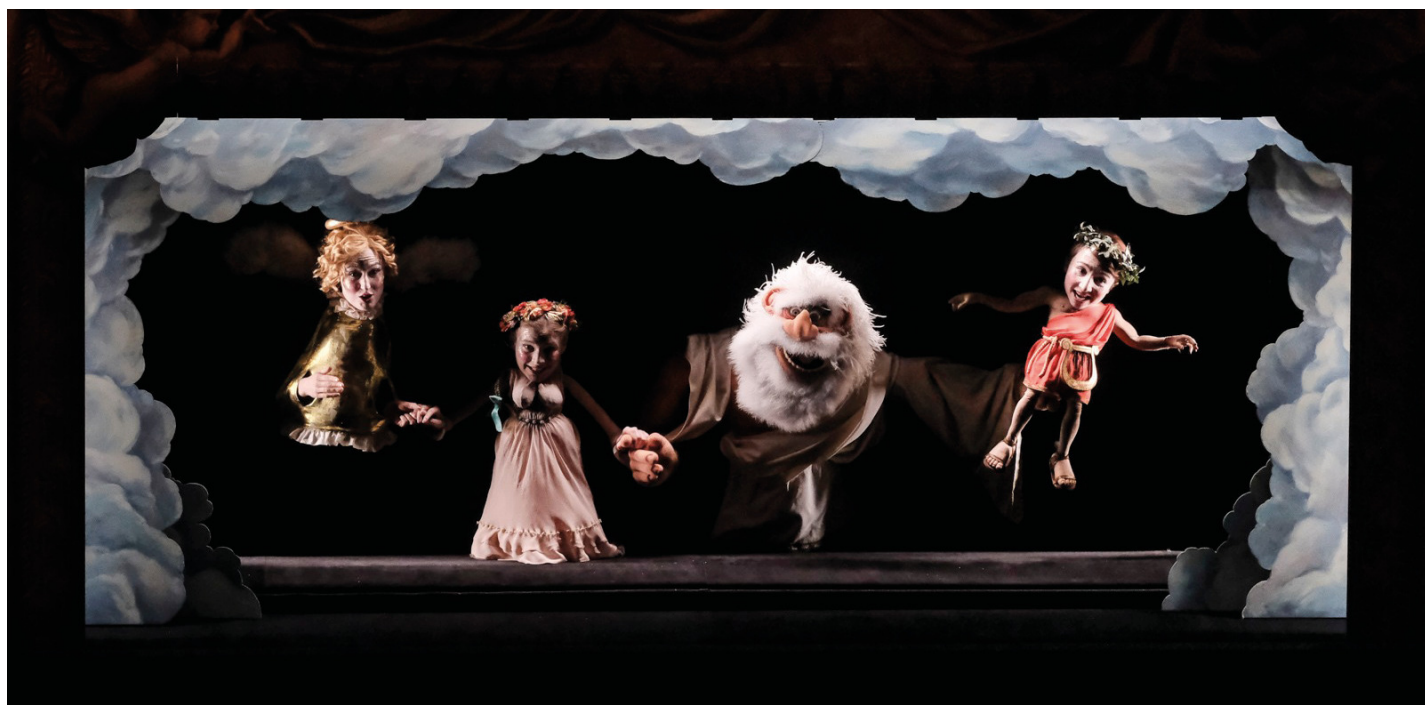
Petite Balade aux enfers saison 22-23

Pendant leur formation, les jeunes artistes de l'Opéra Studio ont l'opportunité de se produire sur scène aux côtés de chanteurs professionnels et de travailler sous la direction de grands metteurs en scène et chefs d'orchestre. Cette saison, les artistes lyriques et pianistes participent notamment à l'Opéra Volant Les Fantasticks présenté en tournée dans le Grand Est. Ils présentent également plusieurs récitals dans le cadre de la programmation des Heures lyriques, dont Les Fables de La Fontaine qui seront mises en scène.