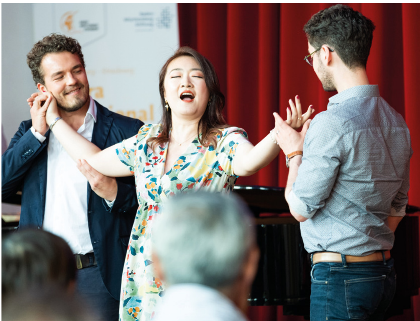
Opéra Studio -22-23

Né du rêve de retrouver le chant d'Orphée, l'opéra fait de la voix son cœur battant. Au fil des siècles, les compositeurs ont exploité et façonné de multiples manières cet organe fragile et complexe pour le mettre au service de leur art. Musique dans le théâtre, parole dans la musique, la voix lyrique est à la jonction des disciplines, au cœur de l'art total qu'est l'opéra. Ce dossier a pour objectif d'explorer les différentes facettes de la voix lyrique : corporelle, façonnée, charmeuse toujours, la voix lyrique est à elle seule un monde sur la scène.