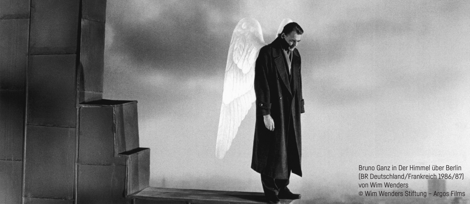
Bruno Ganz in Der Himmel über Berlin [BR Deutschland/Frankreich 1986/87] von Wim Wenders